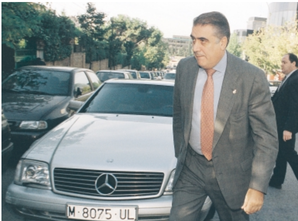
PRESIDENTE EN APUROS. Sanz se sabe débil ante la masa social, los resultados no acompañan y Anelka no funciona. Su imagen ha bajado muchos enteros.