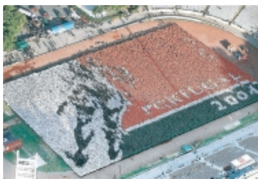
LOGOTIPO. Una formación humana representa el símbolo de la Eurocopa 2004

Debemos ser respetuosos, y lo somos, con las decisiones democráticas, justas y razonadas. La concesión a Portugal, con nuestro máximo respeto para el vecino ibérico, no se sustenta en pilares justos ni razonados, tan solo en el maquillado aspecto democrático de una votación. Ese es su único aspecto respetable. Lo demás es mentirle al mundo aunque el mundo deje de recordar esta faena pasado mañana. Escribimos aquí, hace una semana y media que la razón por la que Portugal era favorita, la única, eran los celos de Aigner respecto a Villar. Me hubiera gustado mucho equivocarme pero las cosas caen por su propio peso. ¿Será esta la última represalia del secretario general?