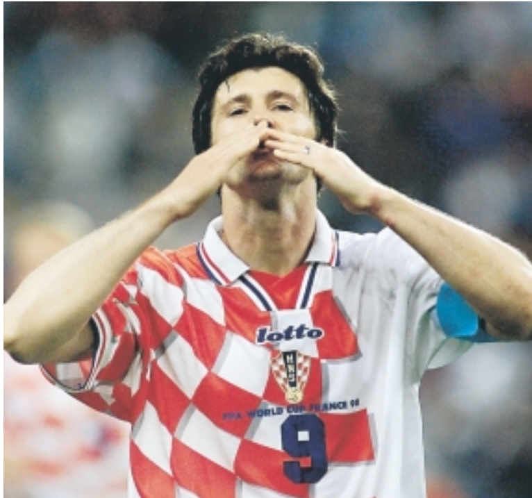
GENIAL. Con la selección croata, Suker ha marcado algunos de los goles más bellos que se recuerdan.

En Sheffield le metió un gol a Dinamarca que me descubrió el fútbol