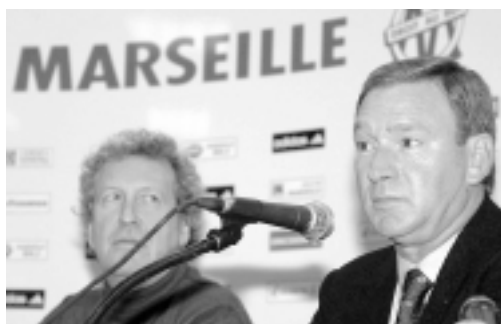
CONTENTO. Javier Clemente, el día en el que firmó por el Olympique.

El partido contra el PSG se había convertido en pieza clave para el futuro del entrenador vasco. Desde la prensa parisina se intentó alterar la convivencia del OM con informaciones de supuestos enfrentamientos entre Clemente y su plantilla. El triunfo, por un gol a cero, ha ennegrecido el campeonato de Luis Fernández en tanto que alivia los problemas del entrenador español. Su posición se ve reforzada.